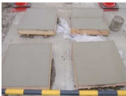
表面仕上げ後、曝露を開始