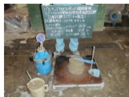
フレッシュコンクリートの物性測定