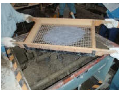
ベースコンクリートへ繊維を添加

供試体 上層の繊維補強コンクリートの収縮を 下層コンクリートで拘束し、ひび割れ を発生させる